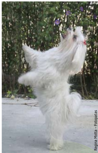
Regina Motta - Fotopatas

COMPRE OU ADOTE ANIMAIS DE FORMA CONSCIENTE. E NÃO SE CALE DIANTE DO COMÉRCIO CLANDESTINO. DENUNCIE ABUSOS.