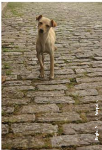
Regina Matta - Fotopatas

Abandonar ou deixar um animal sem cuidados é mau trato (Lei Municipal 13.131/01, Art. 30) e praticar maus-tratos contra quaisquer animais é