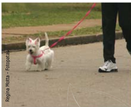
Regina Motta - Fotopatas

E também preste atenção nos limites físicos deles; cuidado para não forçá-los a corridas exaustivas ou levá-los a passear em horários de sol a pino (os animais ficam bem próximos do chão e suas patas são muito sensíveis ao calor). Preste sempre atenção no comportamento de seu bicho de estimação. Cães e gatos não falam a nossa linguagem, mas sabem "dizer" tudo , comunicar tudo, ao seu modo.