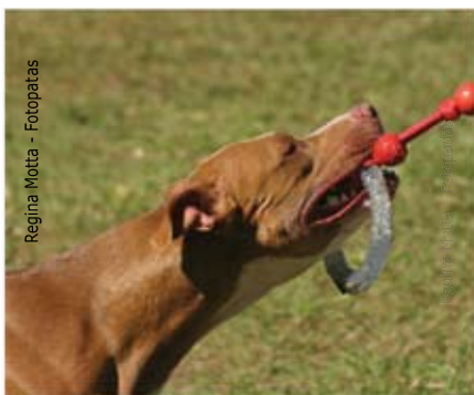
Regina Motta - Fotopatas

Você pode sonhar com um descendente do seu animal de estimação. Mas as cachorras de grande porte podem gerar 10, 12 ou mais filhotes a cada cria , tornando quase impossível conseguir lares para todos eles.