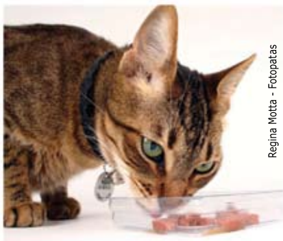
Regina Motta - Fotopatas

Quem opta por ter como animal de estimação um gato deve lembrar que esses animais precisam de formas de contenção diversas dos cães (telas nas janelas, no caso de apartamentos), pois eles praticamente não têm limites em suas escaladas e fugas.